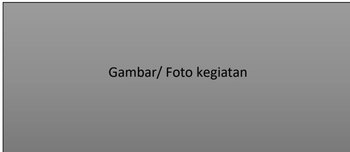
Gambar 2.1 Kegiatan Funding